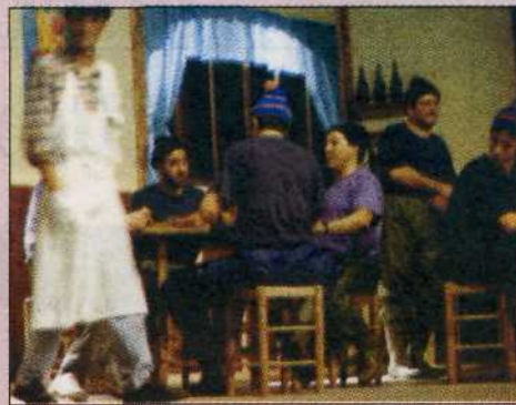
Assaig de 'La Taverera...!' al 1993 CIA SARSUELA

En l'actualitat, l'entitat compta amb més de 50 socis, encara que han estat prop de 200 les persones que s'han creuat en el camí de la Companyia. L'associació ha mantingut un nucli estable, tot i que ha comptat amb nombroses col·laboracions en aquests anys.